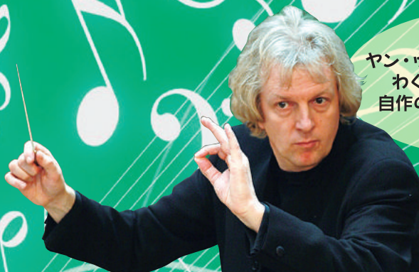
ゲスト(指揮)：ヤン・ヴァン=デル=ロースト

巨匠 ヤン・ヴァン=デル=ローストが わくわくプラス!に登場! 自作の『横浜音祭り序曲』を 指揮します!!